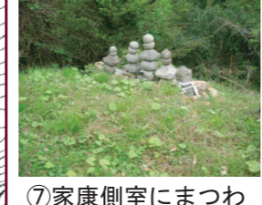
⑦家康側室にまつわる伝承のおかめ塚