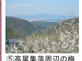
⑤高尾集落周辺の梅林と京都市内の展望