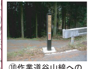
⑩作業道谷山線への入口。ここから下る