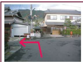
①城之川地蔵前で左に曲がる