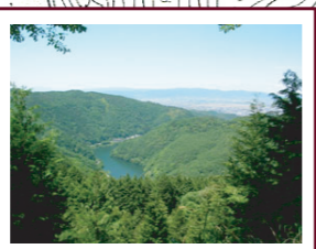
⑨林道からは天ヶ瀬ダム湖を眼下に