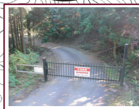
⑪歩行者は通行可能