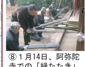
⑧1月14日、阿弥陀寺での「縁たたき」