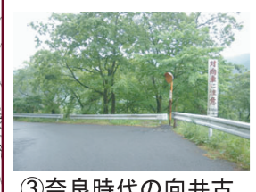
③奈良時代の向井古墓が見つかった場所