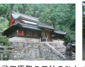
⑬田原祭の三社のひとつ大宮神社と、境内に建つ町指定文化財の宝篋印塔。