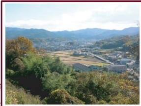
②登り道からは郷之口・南方面を展望