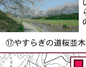
⑰やすらぎの道桜並木

川に沿って谷を降りると大宮神社裏参道に出る。参道を登ると神社境内に、降りると荒木の集落内に入る。