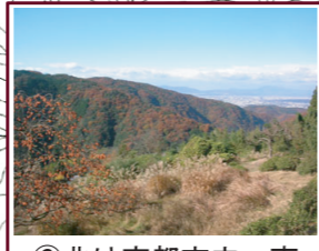
⑥北は京都市内、南は生駒山方面を展望