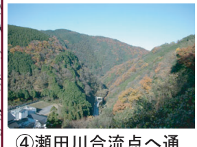
④瀬田川合流点へ通じる峡谷が見える